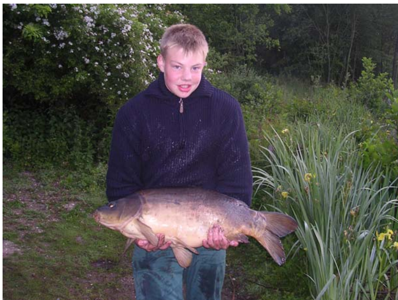
Bild: Nach erfolgreicher Landung, hält unser Jungangler stolz seinen schönen Spiegelkarpfen in den Händen.